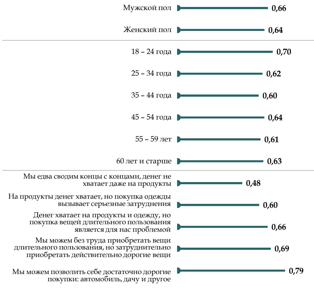
Рис. 2. Индексы удовлетворённости качеством предоставления услуг в сфере физической культуры и спорта по полу, возрасту и материальному положению

пени удовлетворенности качеством предоставляемых услуг.