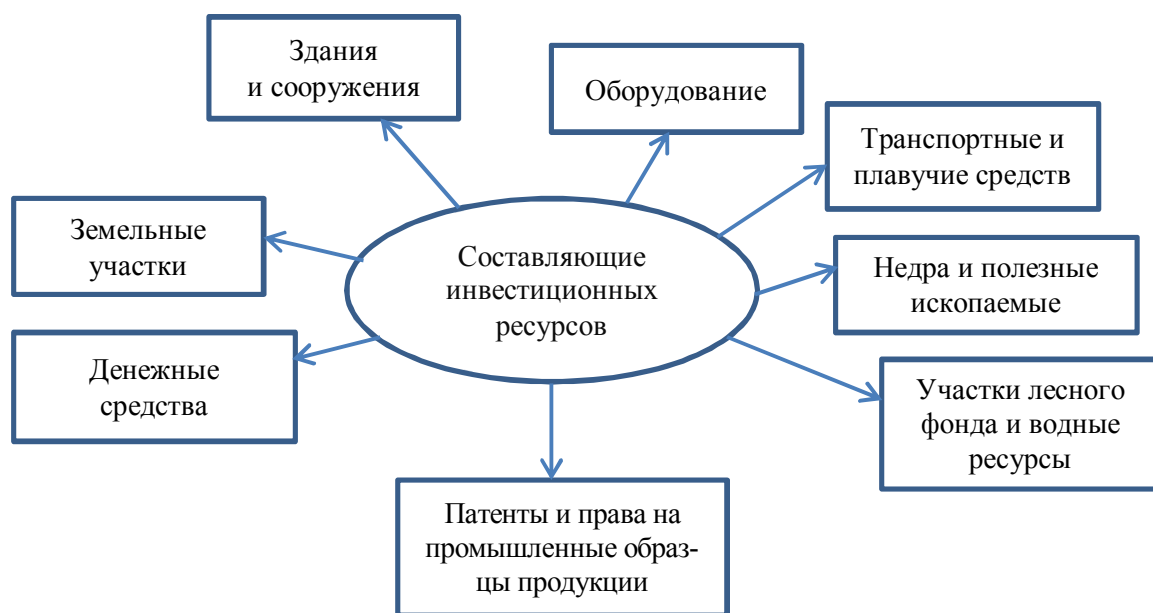
Рис. 2. Составляющие инвестиционных ресурсов [9; 10]

Инвестиции представляются достаточно объемным понятием, которому дано большое количество определений [8], поэтому в рамках настоящего исследования мы данный термин рассматривать не будем. Можно сделать вывод о том, что инвестиционный потенциал наиболее полно можно определить как комплексную характеристику, определяющую качество экономической деятельности субъекта Российской Федерации по привлечению денежных средств инвесторов в те или иные активы. Мы согласны с мнением тех авторов, которые характеризуют инвестиционный потенциал через инвестиционные ресурсы, к которым относится следующая совокупность (рис. 2).