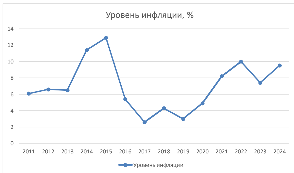
Рис. 2. Динамика инфляции в России за 2011-2024 гг., %

Инфляция в России демонстрировала значительные колебания за последние годы (рис. 2).