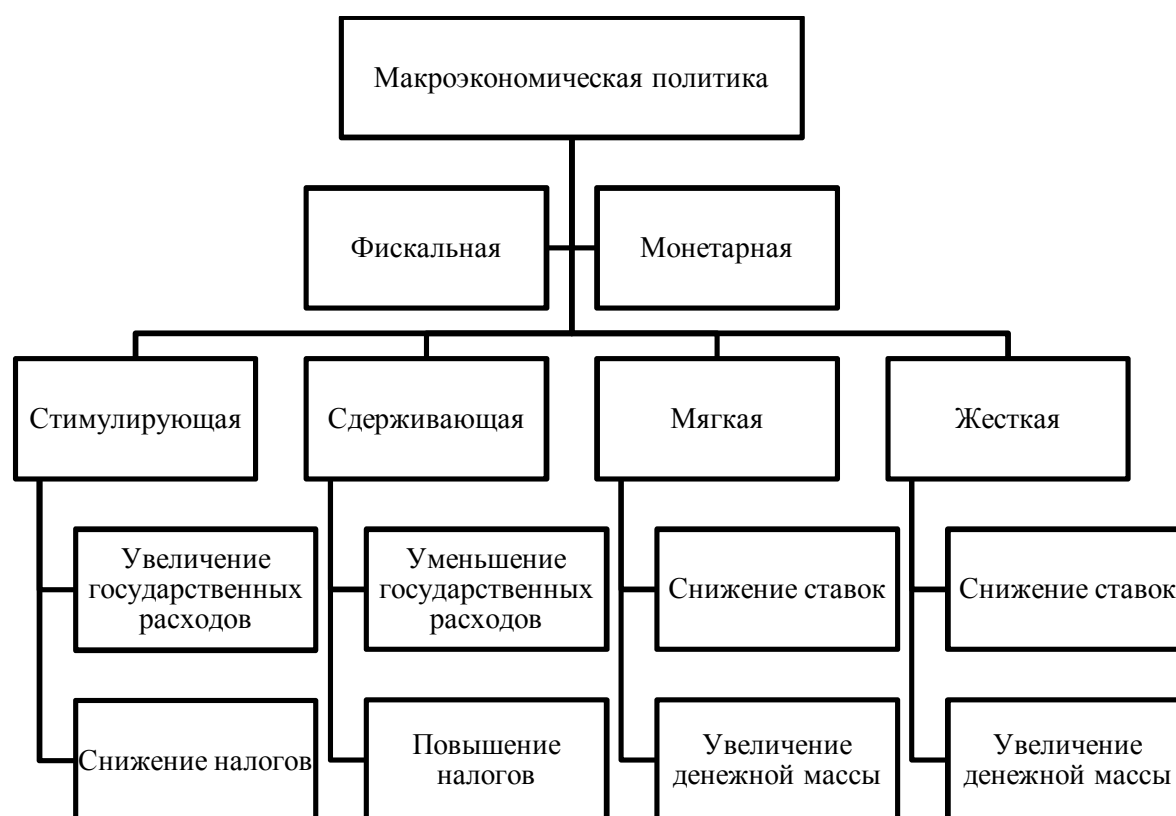
Рис. 1. Виды и инструменты макроэкономической политики

Фискальная политика относится к использованию налогообложения и государственных расходов для воздействия на экономику и достижения определенных политических целей. Налоги, являясь источником государственных доходов, используются для финансирования государственной деятельности, напрямую воздействуя на уровень располагаемого дохода домохозяйств и доходы бизнеса, что косвенно влияет на расходное и инвестиционное поведение обеих групп [8].