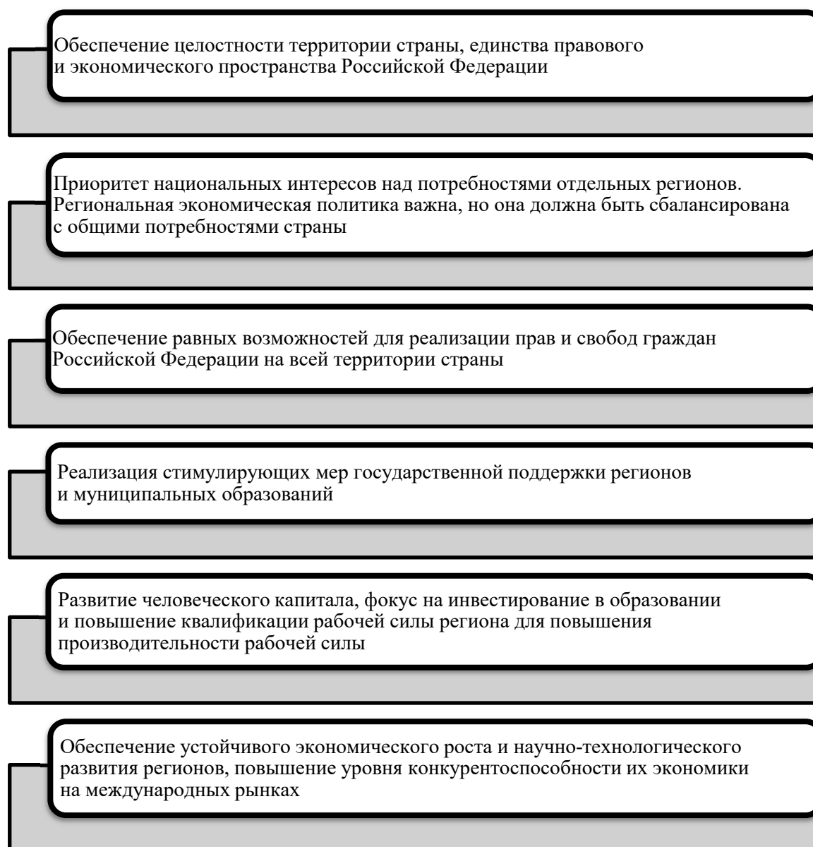
Рис. 1. Принципы региональной экономической политики государства 1

Управление региональной экономикой требует применения различных механизмов, тактик и разработки направлений, нацеленных на развитие региона для улучшения его экономической структуры. Управление экономикой региона должно быть гибким и сочетать в себе множество форм и методов, также