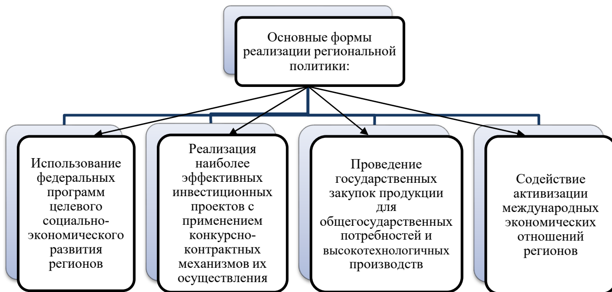
Рис. 3. Формы реализации региональной экономической политики государства

Рассмотрим основные формы реализации региональной экономической политики государства (рис. 3).