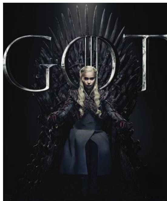
Рис. 2. Постер к сериалу «Игра престолов» (Game of Thrones)

В качестве примера приведем сериал «Игра престолов» (Game of Thrones, с 2011 по 2019 гг.), американский телесериал в жанре фэнтези, основанный на цикле романов «Песнь льда и огня» Джорджа Реймонда Ричарда Мартина. Женских героев в данном киносериале достаточно, – заметно то, что ни автор романа, ни сценаристы не сомневаются в значимости «слабого пола» в истории [15]. Даже в большинстве своем постеры к сериалу (рис. 2) на переднем плане изображают Дейнерис Таргариен (ориг. Daenerys Targaryen) – дочь «Безумного короля» Эйриса II и королевы Рейлы, свергнутых с железного трона во время восстания Роберта, что говорит о ее значимости в жизни сериала.