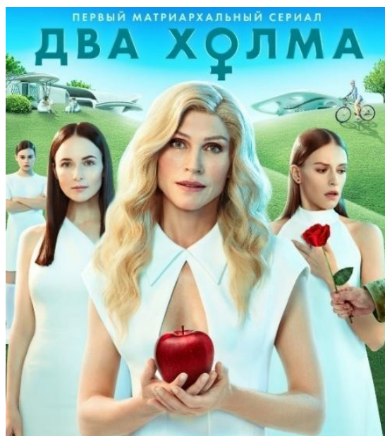
Рис. 3. Постер к сериалу «Два холма»

И противоположный сериал – «Два холма» (с 2022 г. по настоящее время) режиссера Дмитрия Грибанова. Это российский сериал-антиутопия о матриархате, в котором абсолютно всем управляют женщины. Хотя сериал и заявлен в первую очередь как комедийный, все же от истории про матриархат ожидается какой-то если не фемриторики, то, как минимум, уважения к женщинам [16]. Если мы обратим свое внимание на постер к этому сериалу (рис. 3), то также увидим женские образы, раскрывающие суть фильма о матриархате. Оба сериала закладывают в подсознание зрителя характерный образ, выражающий идею доминирования женщины в современном обществе.